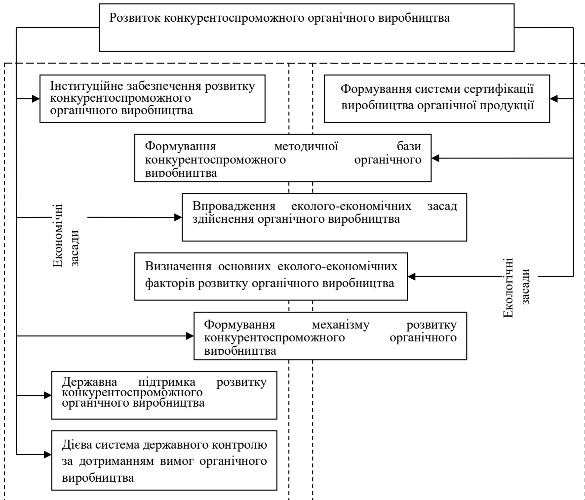
Рис. 2. Еколого-економічні засади розвитку конкурентоспроможного органічного виробництва