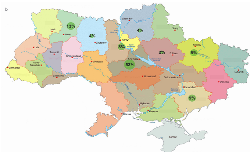
Рис. 3. Розподіл обсягу виробництва органічних круп по областях країни у 2017 році

Географія обсягу виробництва найбільших вітчизняних виробників органічних круп розроблена за даними [13,11] та наведена на рис. 3. Серед них варто виділити такі: ТОВ «Фірма «Діамант ЛТД», ТОВ «Органік оригінал», ТОВ «Органік лайф», ПП «Агроекологія», ТОВ «Кварк», ТОВ «Цефей-Групп», ТОВ «Агрофірма «Поле», ТОВ «Адоніс Люкс», ПП «Галекс-Агро», ТОВ «Дедденс Агро», ТОВ «Сквирський комбінат хлібопродуктів». У сумі вони виробляють левову частку органічних круп в Україні.