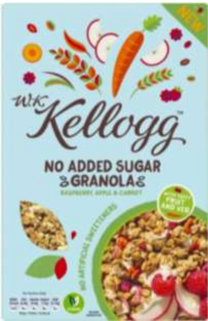
Органічна гранола без доданого цукру з ягодами, фруктами і овочами. Бренд Kellogg (США)

2) поєднують органік з іншими заявленими характеристиками, наприклад: