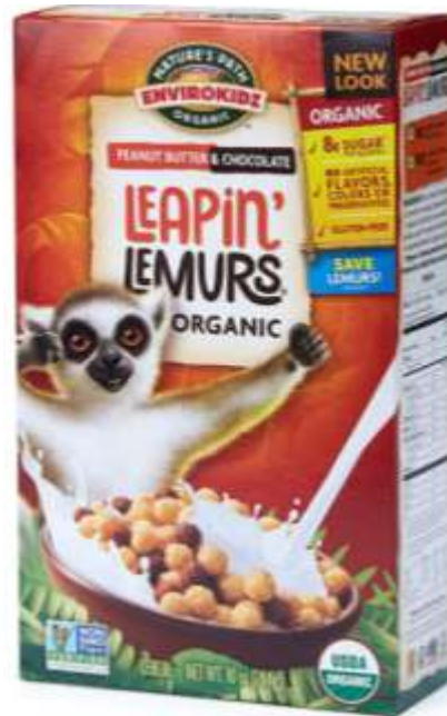
Органічний сніданок для дітей з шоколадом і арахісовим маслом. Бренд Nature's Path Organic (США)