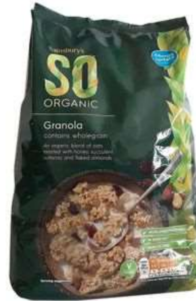
Органічна гранола з вівсяних пластівців з горіхами, родзинками і медом. Бренд Sainsbury's So Organic (Велика Британія)