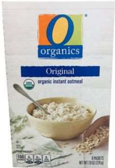
Органічні цільнозернові вівсяні пластівці, що потребують термічної обробки. Бренд O Organics (США)

Категорія hot cereals займає незначну частку в загальному обсязі продажів сніданків, проте динамічно зростає і має позитивну репутацію більш здорового продукту через відсутність шкідливих інгредієнтів та менший рівень обробки