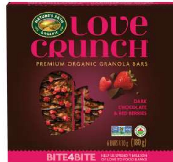
Батончики з органічної граноли з шоколадом і ягодами. Бренд Nature's Path Organic (США)