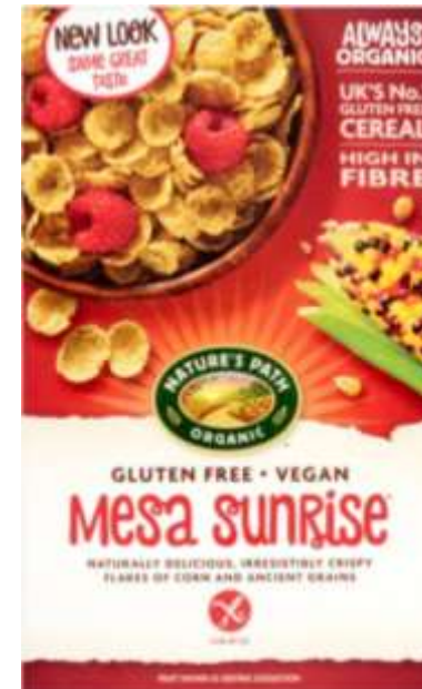
Органічні пластівці без глютену. Бренд Nature's Path Organic (США)