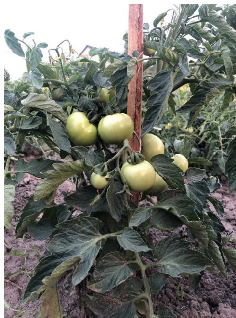
Рис. 2. Колова культура для помідора сорту Етюд