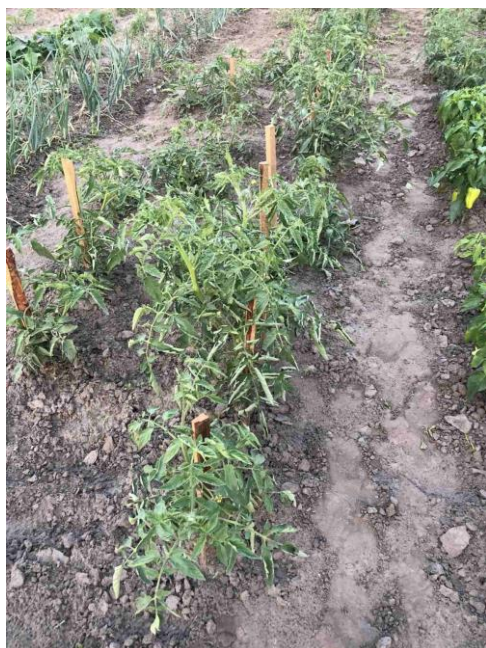
Рис. 1. Догляд за помідорами методами органічного землеробства

У період вегетації догляд за рослинами полягав у систематичному розпушуванні міжрядь, виконанні бур'янів у рядках і поливах (рис. 1). Після утворення плодів стебло вилягає. Тому для помідорів була застосована колова культура (рис. 2).