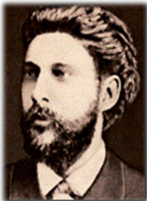
Рис. 1. І. Є. Овсінський (1856–1909)

Ще в 1871 р. І. Є. Овсінський розпочав практичне дослідження вирощування сільськогосподарських культур без застосування глибокої оранки