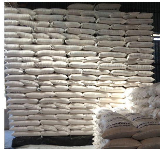
Органічний рис роздріб