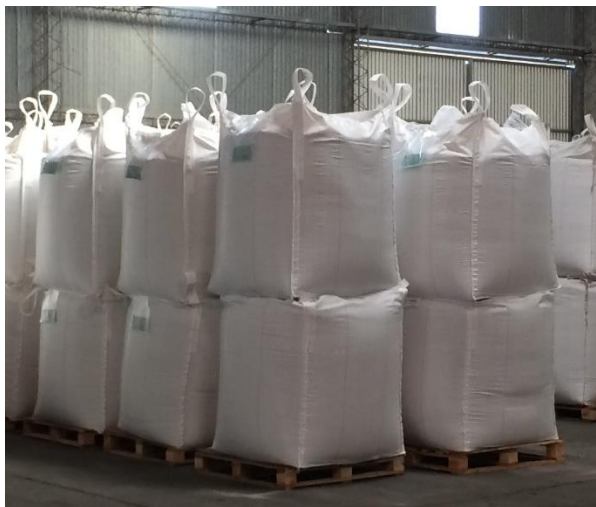
Органічний рис опт