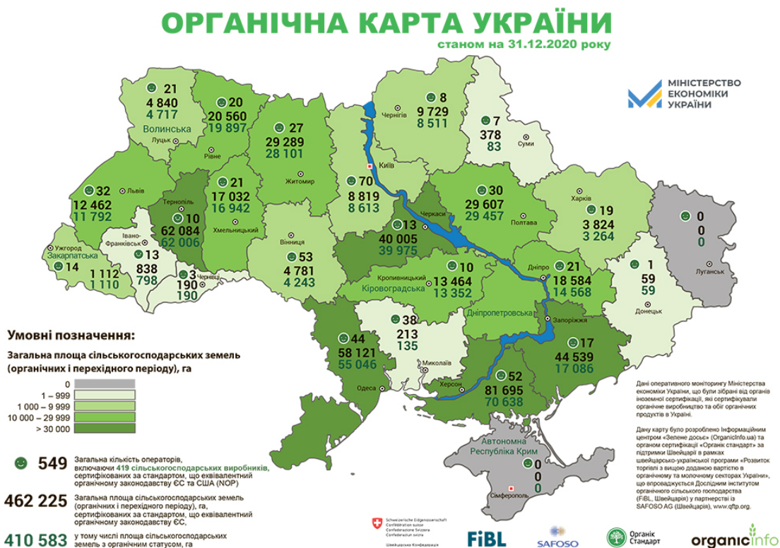
Рис. 1. Органічна карта України станом на 31.12.2020 р.