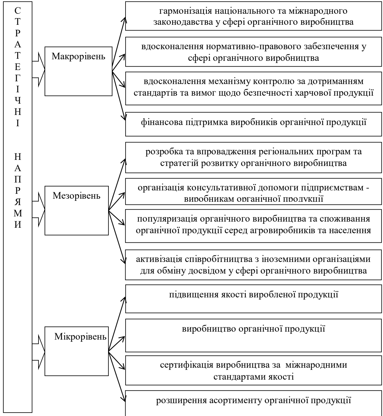
Рис. 4. Стратегічні напрями розвитку харчової органічної продукції на макро-, мезо-, мікрорівнях

стратегічними завданнями розвитку органічної харчової продукції повинні стати: узгодження вітчизняного законодавство відповідно до міжнародного, удосконалення механізму щодо обігу та маркування продукції, формування стратегії розвитку органічної харчової продукції, збільшення державного фінансування.