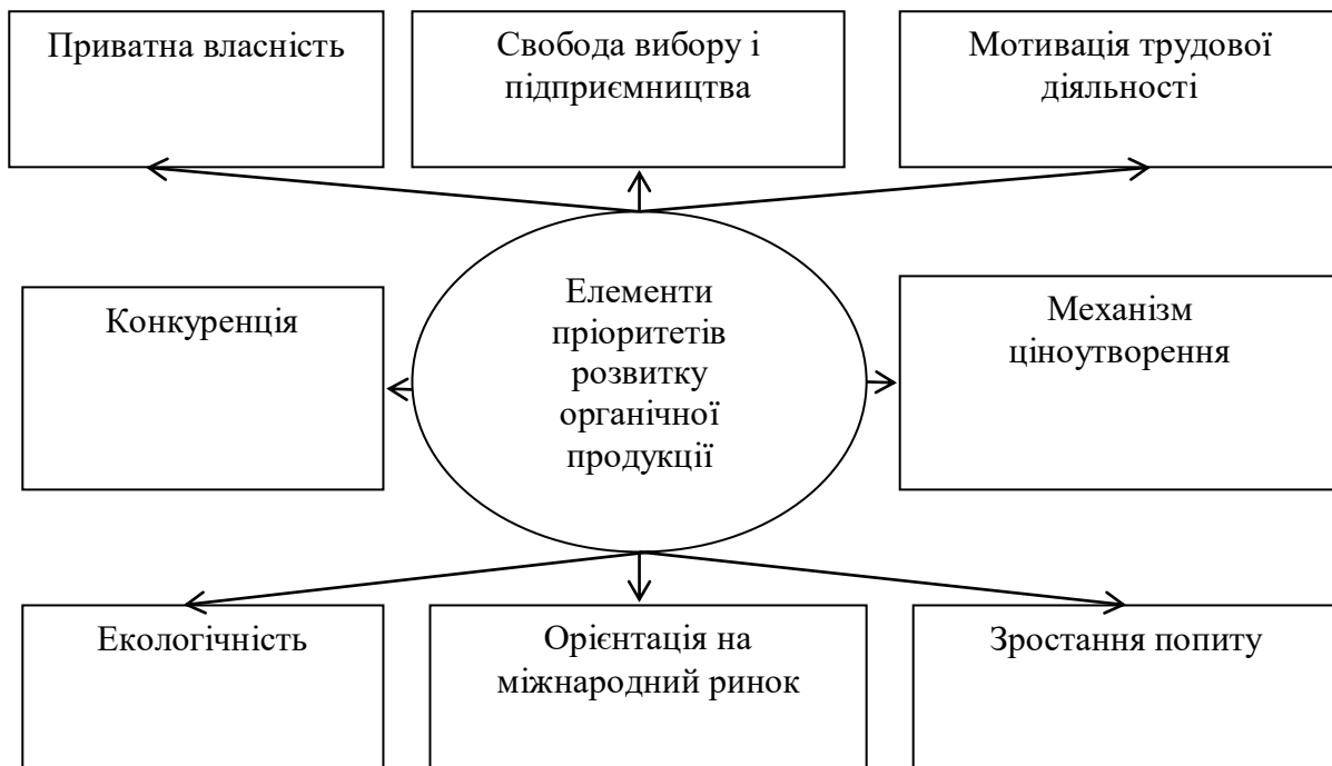
Рис. 3. Основні елементи пріоритетів розвитку органічної продукції

через неспроможність виготовляти готову органічну продукцію та представляти її на рівні з іноземними виробниками» [6, с.201-202].