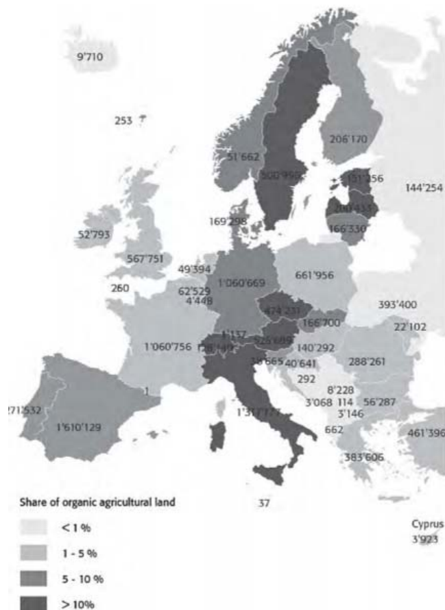
Рис. 1. Органічні сільськогосподарські угіддя в Європі [12]

Найбільші площі під органічним виробництвом зайняті в провідних європейських країнах – Німеччині, Іспанії, Італії, Франції, Швеції та ін. (рис.1).