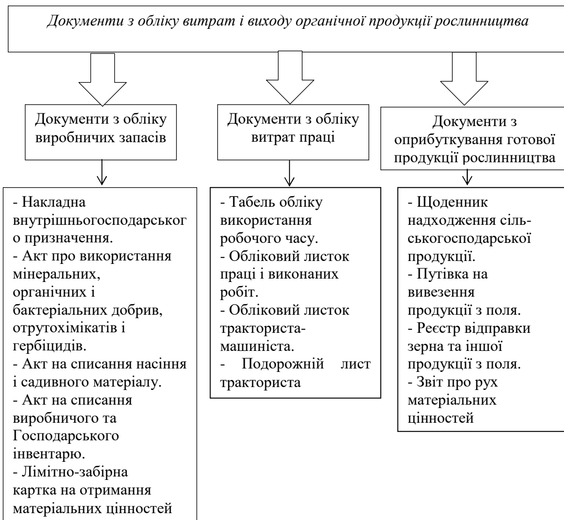
Рис. 2. Документальне оформлення витрат і виходу продукції рослинництва органічного походження

Процес зберігання органічної продукції на складах має особливе значення. Зберігання органічної продукції здійснюється в приміщеннях, що відповідають вимогам, встановленим Кабінетом Міністрів України: зберігання органічної продукції має забезпечувати запобігання будь-якому змішуванню з традиційною продукцією, продукція рослинництва та тваринництва має зберігатися окремо [3].