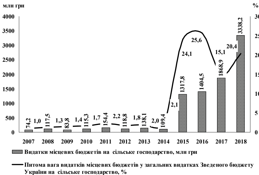
Рис. 3. Видатки місцевих бюджетів України на сільське господарство

дарського виробництва коливалася в інтервалі 97,8—99,0%. Поглиблення процесів децентралізації влади та реформи місцевого самоврядування підвищили питому вагу місцевих бюджетів у загальній величині публічних видатків на підтримку сільськогосподарського виробництва, що автоматично означало зменшення частки головного кошторису країни в структурі цих видатків. Зокрема, питома вага державного бюджету у загальних видатках Зведеного бюджету України на сільське господарство у 2015—