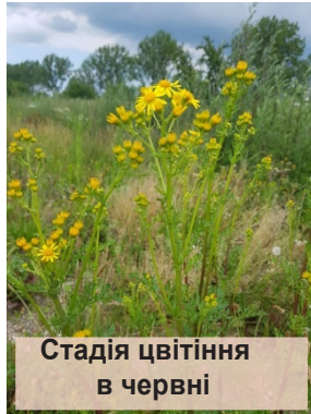
Стадія цвітіння в червні