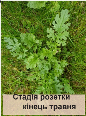
Стадія розетки кінець травня

Якобея ( Senecio jacobaea ; основний період цвітіння з 25 липня по серпень) створює дедалі більшу проблему в сільському господарстві землі Мекленбург-Передньої Померанії, яку необхідно стримувати за будь-яких обставин через високу токсичність якобеї. Оскільки хімічна обробка не дозволяється в органічному землеробстві, під час догляду за луками слід вживати особливо стійких запобіжних заходів