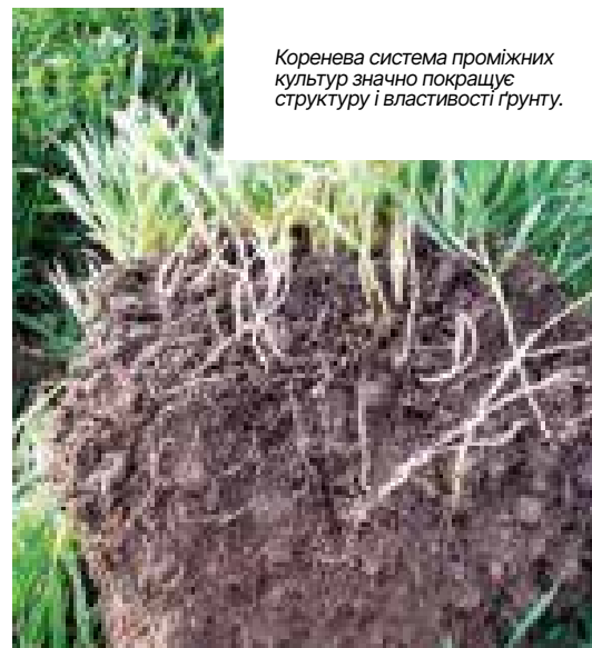
Коренева система проміжних культур значно покращує структуру і властивості ґрунту.

Загалом, але особливо влітку, проміжну культуру слід розглядати як