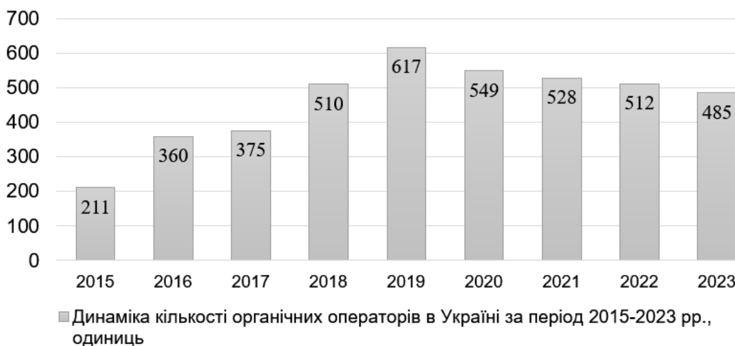
Рис. 1. Динаміка кількості органічних операторів в Україні за період 2015-2023 рр., одиниць

За інформацією Міністерство з питань аграрної політики/продовольства України, до 2022 року загальна площа сільськогосподарських угідь, що використовувалися для органічного виробництва становила 422 299 га, що дорівнює 1% від усієї площі сільськогосподарських земель/територій в областях країни. При цьому, станом на початок 2024 року ця цифра скоротилась до 245 675 га території, або майже на 45% [6]. Загалом, в Україні на кінець 2023 року налічувалося 485 операторів органічного виробництва, серед яких 395 сільськогосподарських виробників мають сертифікацію від іноземних органів відповідно до стандартів Регламенту Ради (ЄС) № 834/2007 та NOP (США) (рис. 1). Ці дані були отримані в результаті оперативного моніторингу, проведеного Міністерством аграрної політики через опитування органів сертифікації, що займаються органічним виробництвом і обігом органічної продукції в Україні.