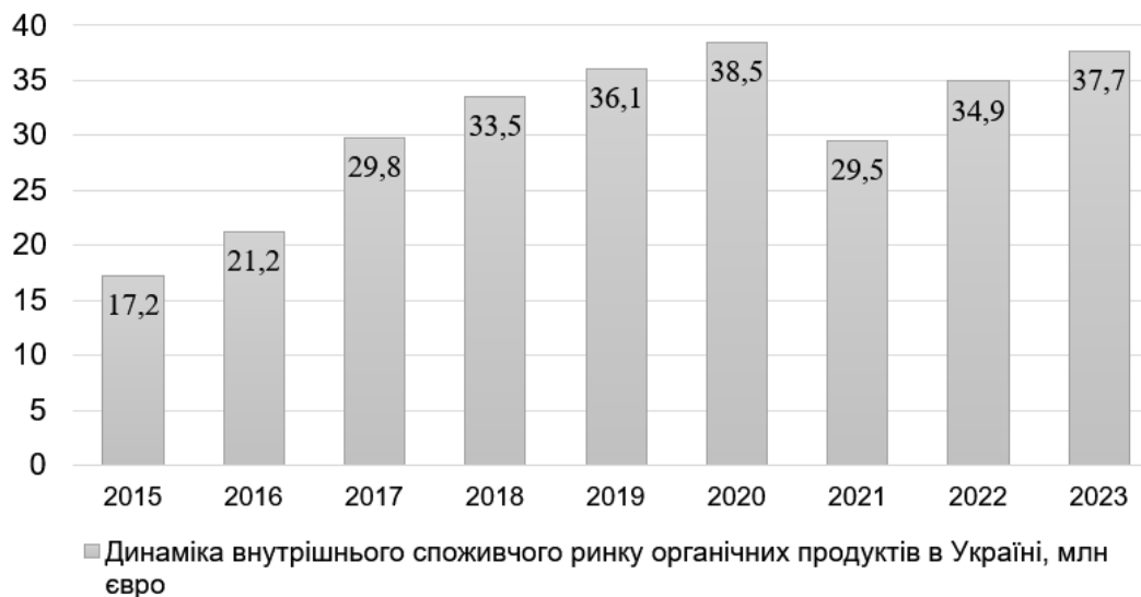
Рис. 4. Динаміка внутрішнього ринку споживання органічної продукції в Україні, млн євро