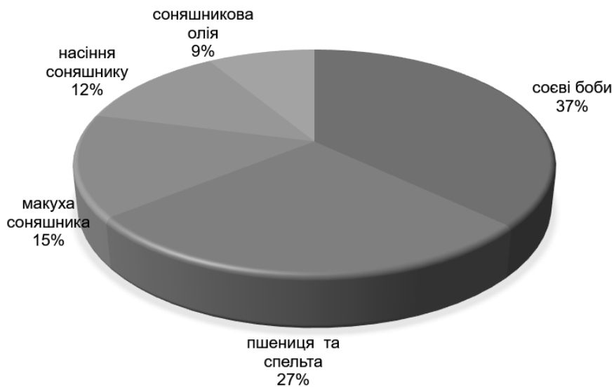
Рис. 3. Структура органічної продукції експорту на кінець 2023 року, %

та молочного секторах України» (QFTP) та «Органічна торгівля заради розвитку» (OT4D) провели дослідження органічного ринку та визначили, що внутрішній споживчий ринок даного сегменту в Україні складає 38,0 млн. євро. Порівняно з 2004 роком, цей показник був на рівні 0,1 млн. євро.